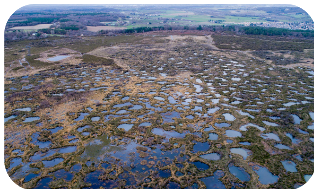
Illustration © R. Raimond Auteur : Kévin Lelarge, conservateur à l'association GEREPI

Cela n'aura échappé à personne, depuis plusieurs années, le changement climatique s'intensifie avec des températures qui montent et une ressource en eau qui se raréfie. Rivières en assec, végétations en souffrance, restrictions d'usage de l'eau de plus en plus sévères : la gravité de cette situation est désormais bien perceptible. Seulement, cette situation n'est pas inéluctable, il est possible et même indispensable d'atténuer et de s'adapter au changement climatique. En ce sens, la préservation des milieux humides comme les mares, prairies inondables, tourbières, forêts alluviales, cours d'eau... est une clé de réussite puisqu'ils stockent et épurent l'eau naturellement, régulent le climat et abritent une biodiversité rare et menacée.