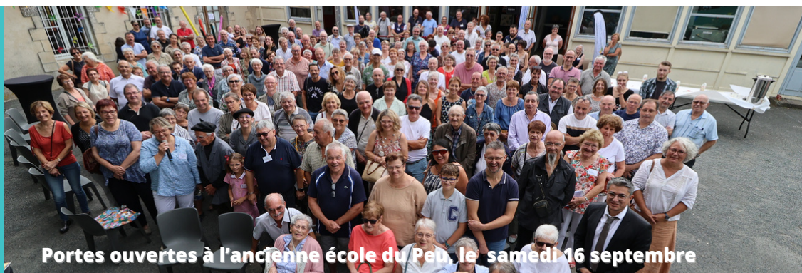
Portes ouvertes à l'ancienne école du Peu, le samedi 16 septembre